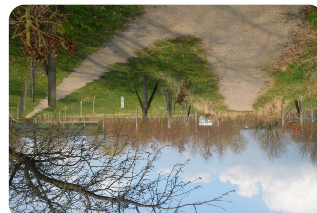
9 LE COIN NATURE DE NOORDPEENE Noordpeene

Le village de Noordpeene, situé entre monts et marais en Flandre, est un petit territoire vivant au riche patrimoine. Traversé par la Feene et dominé par l'église Saint-Denis, il offre des paysages typiques, entre collines boisées et val- lées paisibles. À côté de la mairie, vous trouverez le coin nature de Noordpeene, qui fait partie des plus anciens coins naturels du parc. Non loin de là vous trouverez la Maison de la Bataille qui retrace la bataille de la Feene, opposant les troupes de Louis XIV aux Hollandais. Cette victoire française permet l'annexion de cette partie de la Flandre au royaume de France.