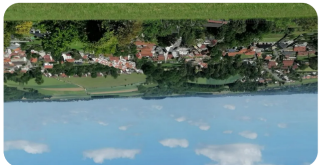
12 LE MONT GÉANT Wavrans-sur-Aa

Le Mont Géant domine la vallée de l'Aa, un site marqué par la nature, l'histoire et les légendes. Selon la tradition, un géant endormi y serait enfoui, donnant au lieu une di- mension mystérieuse. La vallée a connu une forte activité industrielle grâce au fleuve, avec de nombreux moulins puis des papeteries au XIXe siècle, contribuant à sa prospérité. Quelques vestiges, comme des cheminées de briques, rap- pellent encore ce passé lié aux minoteries et à une ancienne brasserie. Le site présente aussi un intérêt archéologique important, avec des traces d'occupation du Paléolithique et du Néolithique, notamment aux Mardelles.