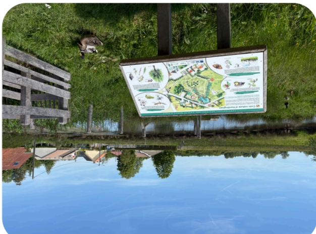
10 LE COIN NATURE D'HARDINGHEN Hardinghen

À Hardinghen, le coin nature a été réalisé par Eden 62 et la municipalité qui souhaitaient préserver au maximum la zone humide existante. Des aménagements légers, comme des barrières bouillonnaises et un chemin, permettent de s'y promener. Une mare favorise les amphibiens, les pra- ires sont pâturées par des moutons, et du mobilier permet d'observer la nature. Un lieu paisible où petits et grands peuvent profiter d'une balade au cœur de la nature et de- couvrir la richesse de cet espace préservé.