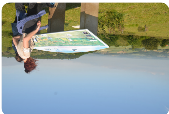
11 LE COIN NATURE DE COLEMBERT Colombert

Le communal de Colombert fait partie de la chaîne de co- teurs du boulonnais ou « cuestas » dont le Mont Dauphin est l'un des points culminants. Offrant un panorama sublime, le communal présente des pelouses calcicoles rares avec un intérêt écologique majeur. Il est classé Natura 2000. Dès le printemps, ses pelouses sèches se couvrent d'orchi- des sauvages et des milliers de papillons y trouvent refuge quand le soleil chauffe les parcelles. Depuis le haut du co- teau, une vue panoramique permet d'admirer le château de Colombert et son allée majestueuse. Au bas du coteau, le petit fleuve côtier, le Wimereux, prend sa source pour aller se jeter dans l'estuaire de la commune du même nom à 22 kilomètres de là.